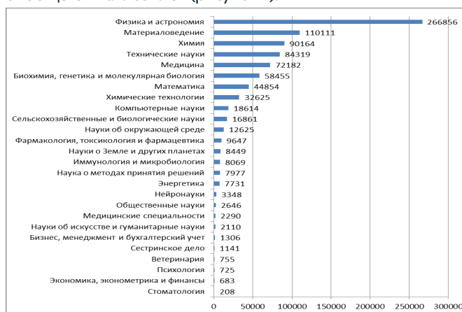
Рисунок 2. – Распределение ссылок на публикации Беларуси по тематическим направлениям Scopus (данные на декабрь 2021г.)

Такая область знания, как физика, стала лидером и по числу цитирований на работы белорусских ученых – 53,3% от общего числа ссылок (рисунок 2).