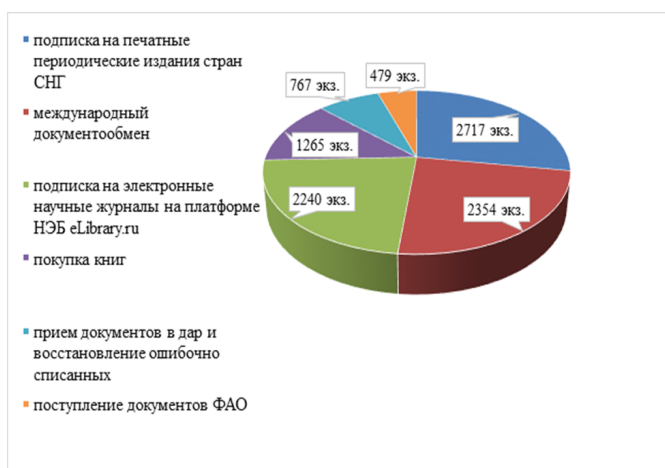
Рисунок 1. – Поступления зарубежных изданий из основных источников комплектования в 2017–2021 гг.

Всего за указанный период в фонд библиотеки поступило более 20 тыс. печатных и электронных экземпляров документов из них 9822 экз. зарубежной литературы, в том числе по подписке на электронные научные журналы на платформе «Научная электронная библиотека eLibrary.ru» был приобретен online-доступ к более 2,7 тыс. номеров сериальных и периодических изданий (рисунок 1).