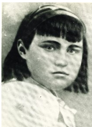
Рисунок 2. – Фото В.И. Зенкиной 1941г. из фондов Мемориального комплекса «Брестская крепость-герой» Figure 2. – Photo of V.I. Zenkina, 1941, from the funds of the Memorial complex “Brest Fortress-Hero”

воинах Брестского гарнизона, но и о женщинах-смолянках, участницах обороны крепости.