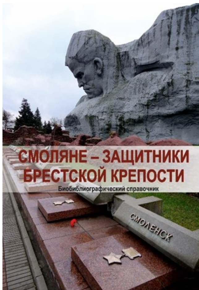
Рисунок 1. – Обложка биобиблиографического справочника «Смоляне – защитники Брестской крепости»

В Брестском гарнизоне в начале Великой Отечественной войны служили около 500 смолян. До сих пор не известно, сколько солдат и офицеров Красной армии, в том числе и смолян, погибло при защите цитадели. В справочнике представлены персоналии 344 воинов Брестского гарнизона,