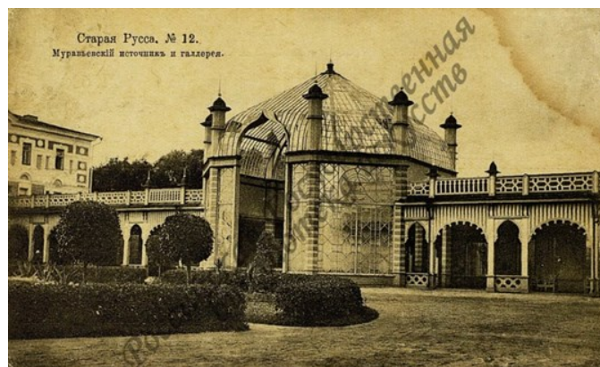
Рисунок 2. – Изображение лицевой стороны открытки в ЭКРГБ Figure 2. – Image of the front side of a postcard in the electronic catalogue of the Russian State Art Library

изданий. В методическом пособии «Работа с изобразительными материалами в библиотеках» приведена схема научного описания изоизданий и изобразительных документов, объединяющая требования, предъявляемые музеями и библиотеками к описанию документов. Данная схема включает следующие элементы: заглавие; автор (художник, гравер, фотограф); место издания, издательство, печатная мастерская, типография, год издания, время создания; техника исполнения, размеры в сантиметрах; особенности печати; характеристика бумаги, наличие водяных знаков; печатные тексты, находящиеся на листе, с указанием их расположения; описание особенностей экземпляра; информация о происхождении экземпляра; описание физического состояния экземпляра; краткое описание изображения на листе; справочная литература; индивидуальный регистрационный номер (инвентарный) и др. [1, с. 33].